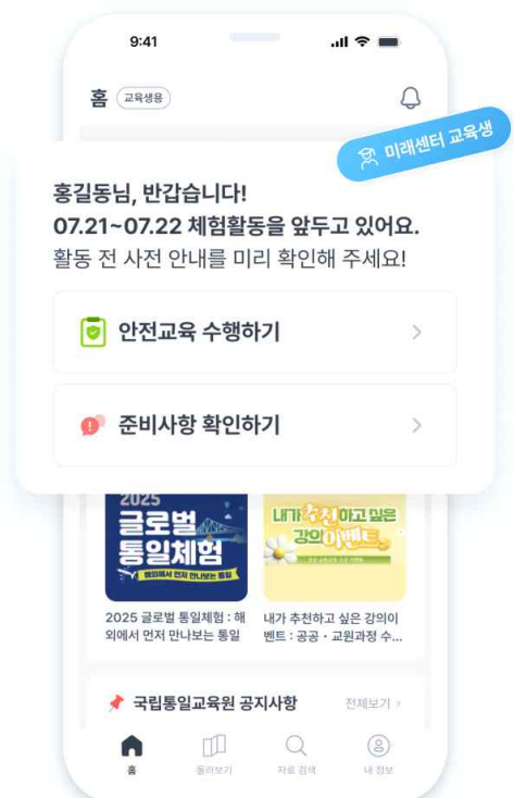
미래센터 사전교육 안내