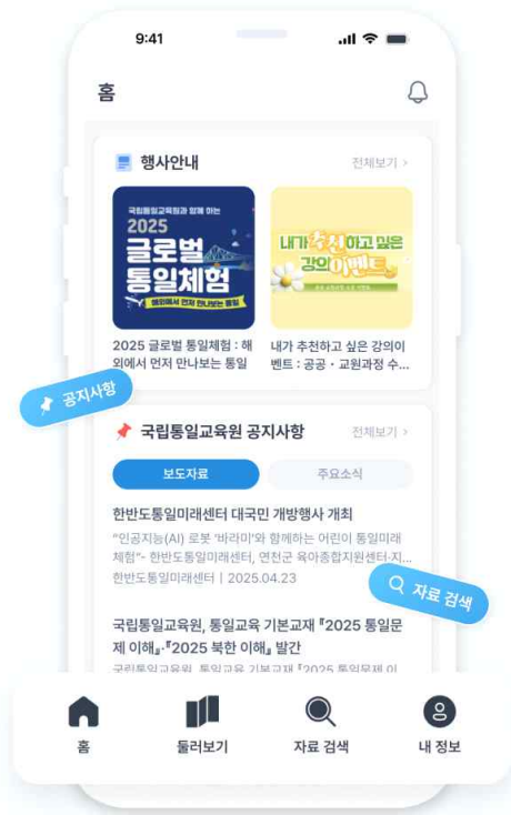
대국민 서비스 홈 화면