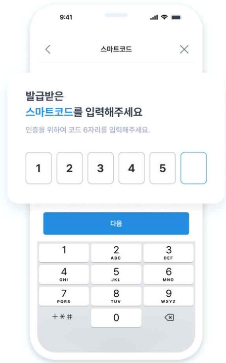
교육생 스마트 로그인