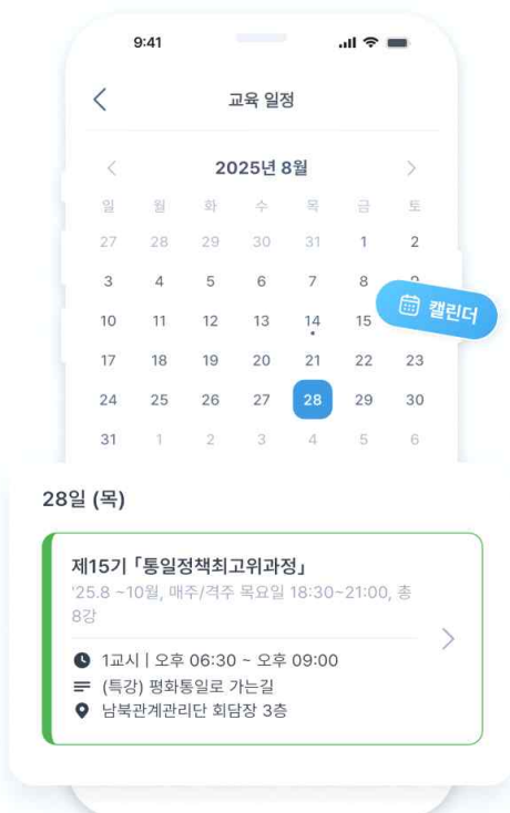
교육원 교육과정 안내