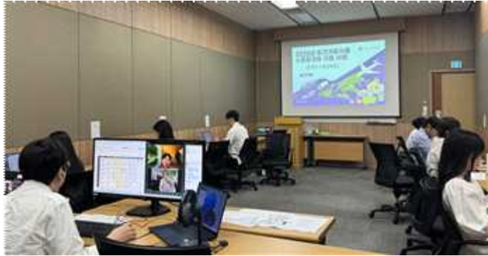
온라인 수출상담회 운영·지원 장면