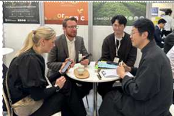
국제유기식품박람회(BIOFACH, 독일) 홍보 및 수출상담 장면