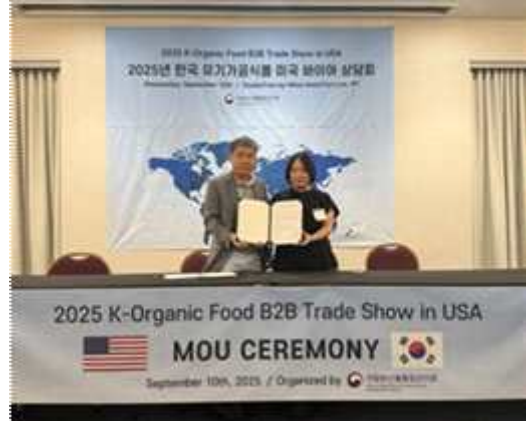
해외 현지 바이어 수출상담 및 수출업무협약 장면