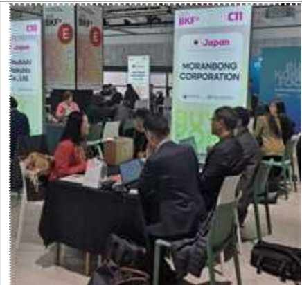
바이어 초청 수출상담회(BKF+) 참가업체 제품 홍보 부스 및 수출상담 장면