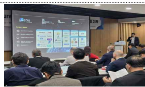
투자자 대상 IR 피칭