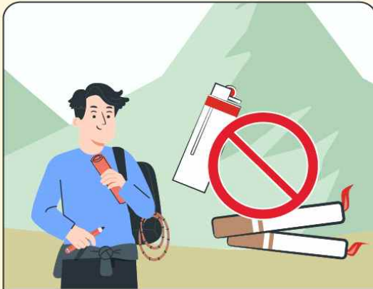
산행시ライター, 버너 등 화기 소지 및 흡연 금지

산림이나 산림인접지역에서 불을 피우거나 불을 가지고 들어가면 200만 원 이하 과태료