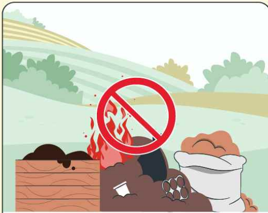
영농부산물, 쓰레기 등 불법 소각 금지