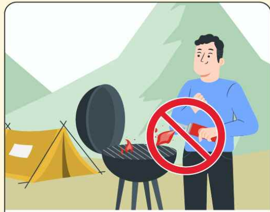
취사·야영·실화 등으로 산불 시 처벌

산림이나 산림인접지역에서 불을 피우거나 불을 가지고 들어가면 200만 원 이하 과태료