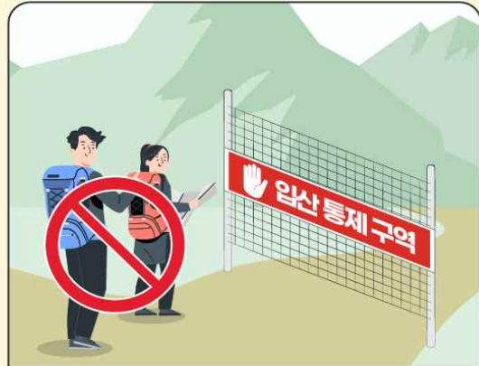
입산통제구역, 등산로 폐쇄 구간 출입금지