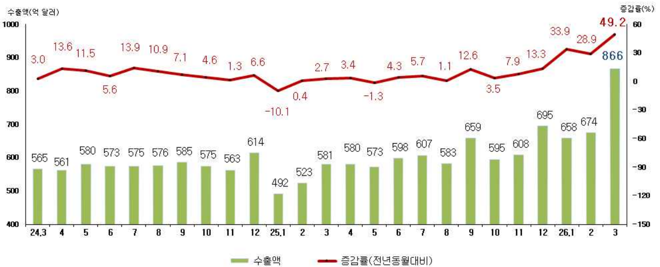
< 월별 수출액 및 증감률 >