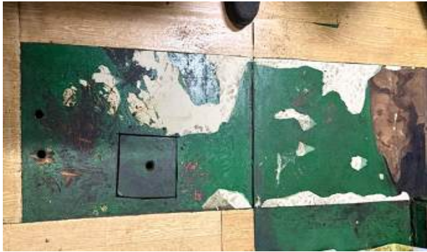
바닥 장판 제거 후 가공한 바닥재 흔적 발견