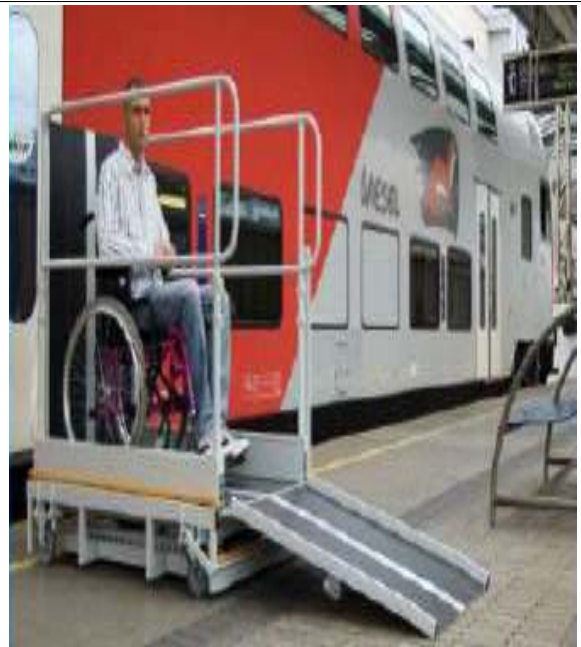
< 승하선 편의시설 개선 >