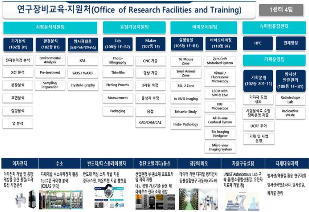
[ UNIST 연구지원본부 조직체계 및 지원분야 ]

- '08년 12월 UNIST 설립 '중앙기기센터' 개원(인력 4명, 장비 125대) - '11년 연구지원본부로 부서명 변경(인력22명, 장비172대), 현재 1센터 4팀(인력59명, 장비511대) 운영 중 - 24시간 사용자 직접사용이 가능한 국내 유일 개방형 Core Facility → 첨단장비 516대(880억원), 연구장비전문가 49명(석·박사급 73%)으로 운영 - 양자·반도체, 이차전지, 수소, 첨단 모빌리티, AI(자율구동 실험), 첨단 로봇·제조, 차세대 원자력, 항공·해양 등의 분야 지원