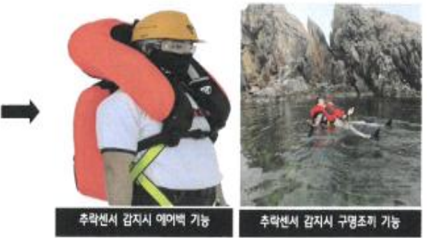
추락센서 감지시 에어백 기능