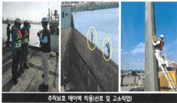
추락보호 에어백 착용(신호 및 고소작업)