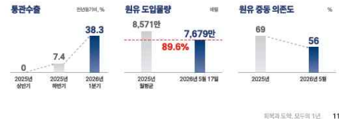
외국과 도약, 모두의 1년 11

• 전략경제협력특사단 등 활동으로 연말까지 원유 대체물량 약 3억 배럴 도입 확정