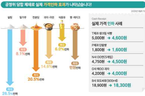
외국과 도약, 모두의 1년 23

• 설탕 26.5%, 밀가루 4.2~8.1%, 전분당 3.4~20.5% 인하 • 과자-리면 2.9~14.6%, 식용유 3~6%, 빵-케이크 최대 14% 인하 등