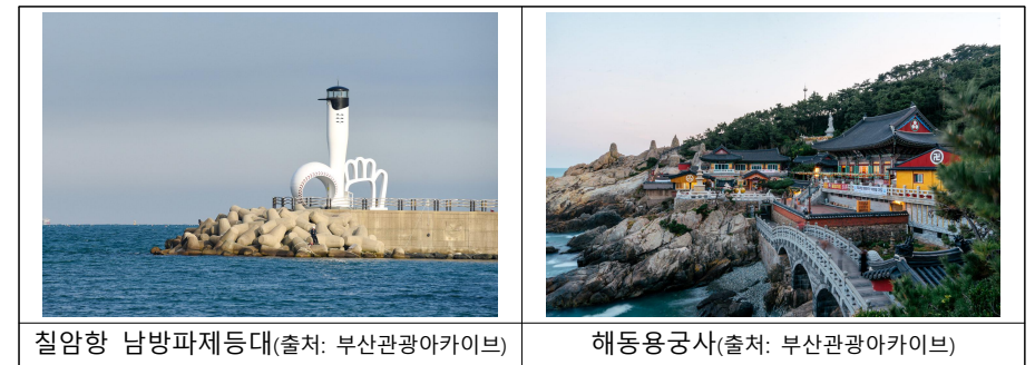
칠암항 남방파제등대