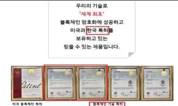
디지털케어 제품 △ 소멸된 권리 표시