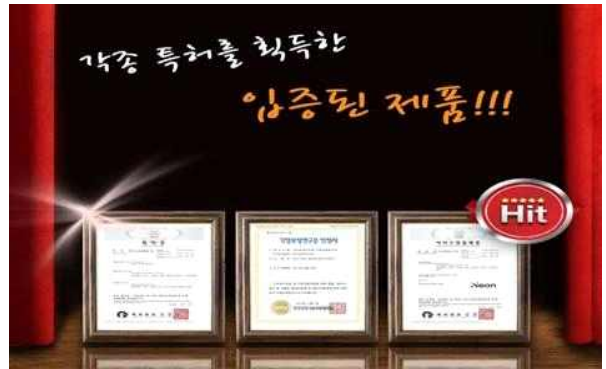
생활편의 제품 △ 소멸된 권리 표시