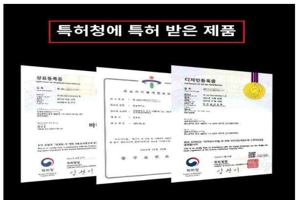
건강관리 제품 △ 지재권 명칭 오류 표시(디자인을 특허로 표시)