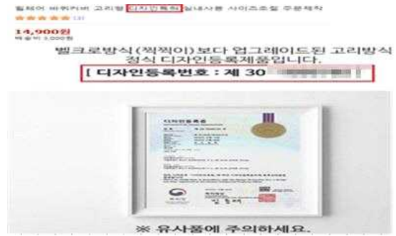
이동보조 제품 △ 지재권 명칭 오류 표시(디자인을 특허로 표시)