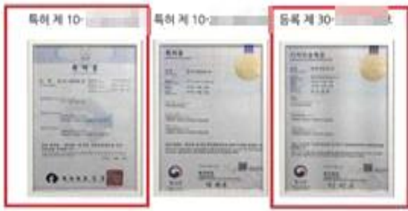
생활편의 제품 △ 소멸된 권리 표시