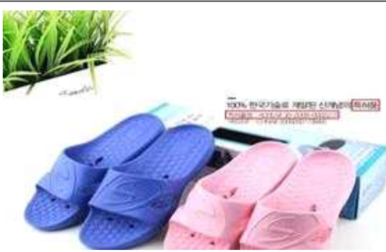
안전예방 제품 △ 소멸된 권리 표시