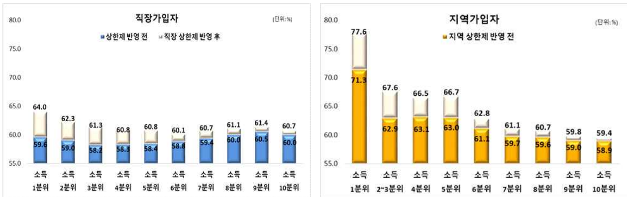
< 2021년 직장·지역 가입자 소득계층별 건강보험 보장률(상한제 반영 전·후 비교) >

□ 보장률 산식에 포함되는 항목 중 ‘제증명수수료’와 같은 행정비용, ‘영양주사’, ‘도수치료’, ‘상급병실료’ 등 급여화 필요성이 낮은 항목을 제외하여 치료적 필요도가 높은 항목 중심으로 보장률을 산출한 결과, 현 건강보험 보장률(64.5%)보다 1.9%p 높은 66.4%로 나타났다.