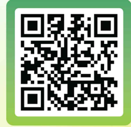
기후행동 실천 선언 QR