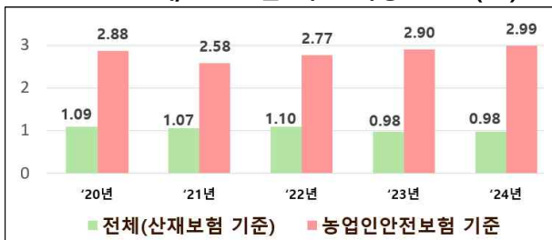
< 연도별 산재/안전보험 기준 사망만인율(‰) >