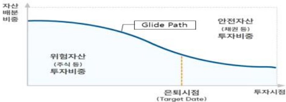
<예시> TDF 자산배분곡선(Glide Path)