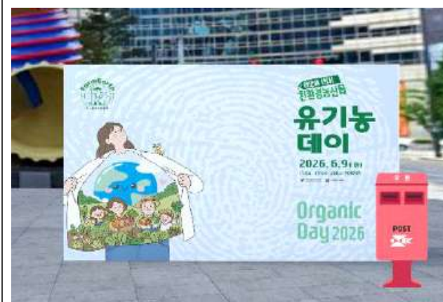
(주제관) 친환경 실천다짐(포토존)