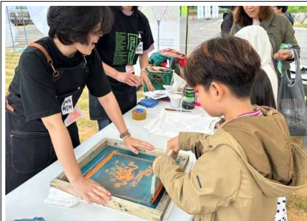
유기농씨앗 키링 체험