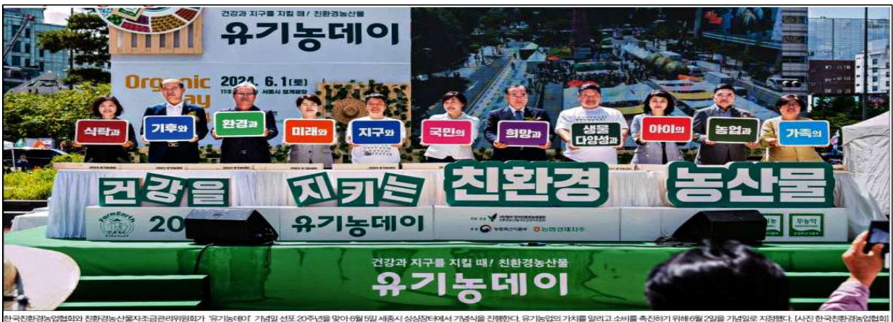
한국친환경농업협회와 친환경농산물자조금관리위원회가 유기농데이 기념일 선포 20주년을 맞아 6월 5일 세종시 상상문화에서 기념식을 진행했다. 유기농업의 가치를 알리고 소비를 촉진하기 위해 6월 2일을 기념일로 지정했다.