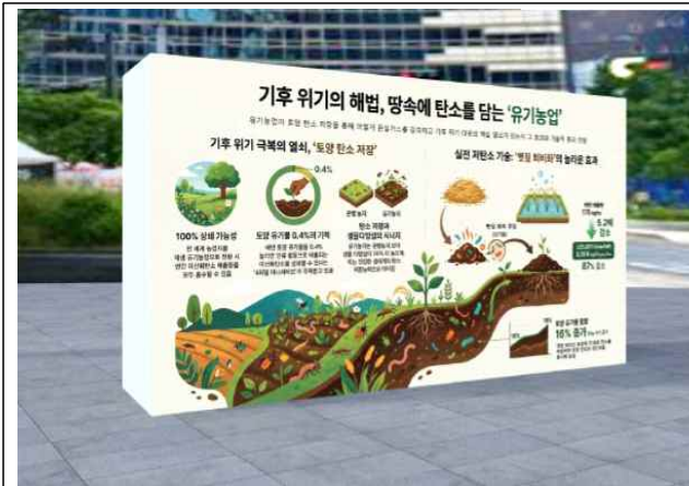
(주제관) 지구를 지키는 유기농업