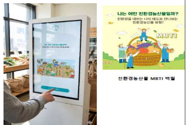
(주제관) 친환경농산물 MBTI