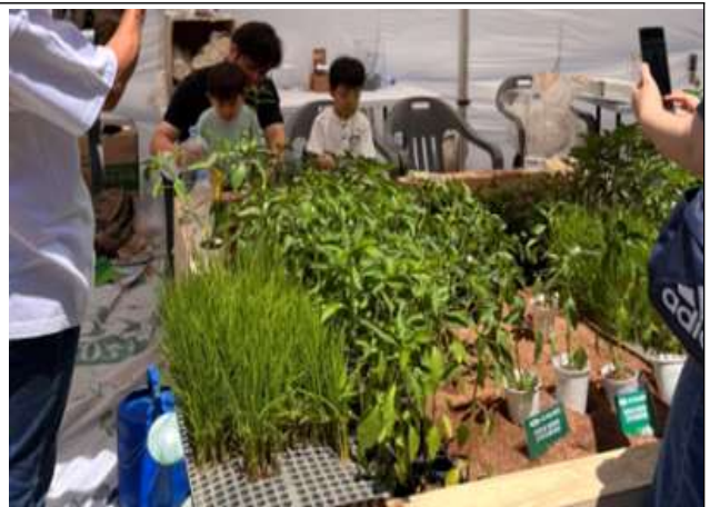
유기농 컵텃밭 체험