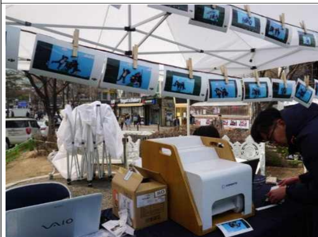
웃는 얼굴 사진관