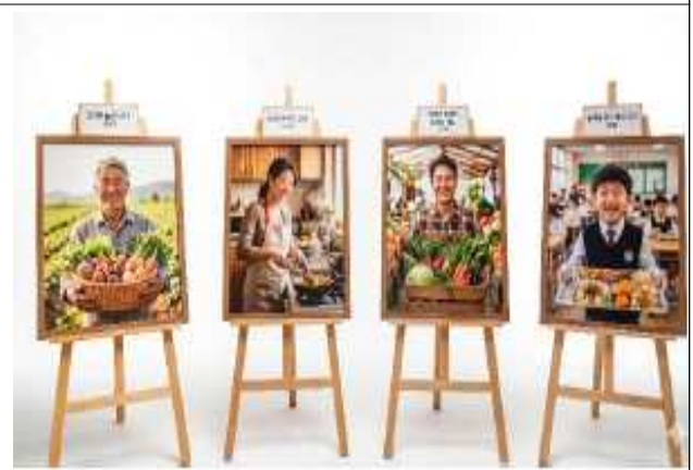
(주제관) 인스타툰공모전 수상작 전시