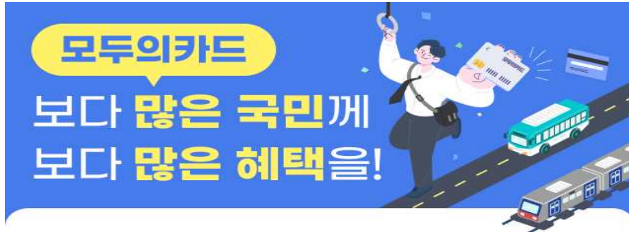
모두의카드 혜택 확대(추경)