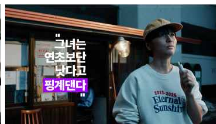
그녀는 연초보단 낫다고 핑계댄다