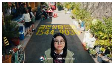
금연상담전화 1544-9000 보건복지부 KHEPI 금연지원사업