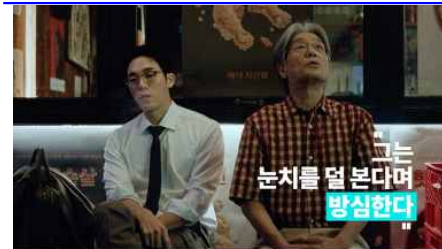
그는 눈치를 볼 본다며 방심한다