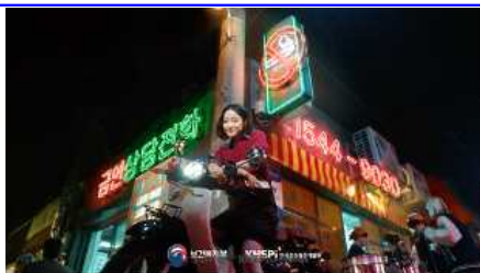
금연상담전화 1544-9030 보건복지부 KHEPI 한국건강증진개발원