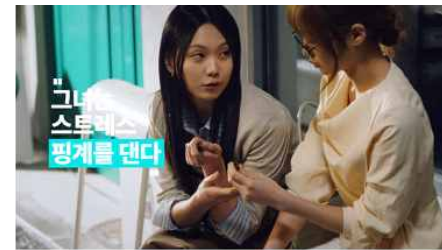
그녀는 스트레스 핑계를 댄다