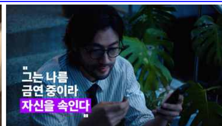
그는 나를 금연 중이라 자신을 속인다