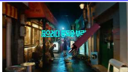
꽂으러다 중독을 부르는