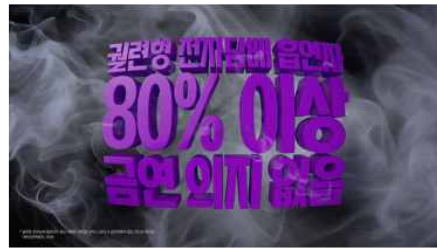
관련형 전자담배 흡연자의 금연 계획은 대부분 1주 이내 금연에 계획이 없는 것으로 확인됨 * 출처: 대한금연학회지 2025