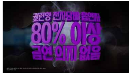
관련형 전자담배 흡연자 80% 이상 금연 의지 없음