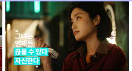
그녀는 언제든 꿈을 수 있다 자신한다