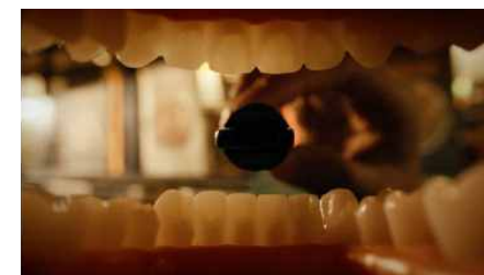
세상 가장 교묘한