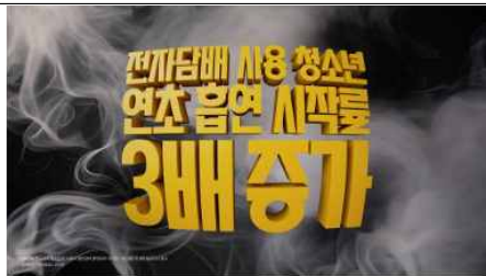
연초는 청소년의 전자담배 사용이 증가함에 따라 흡연 시작률 3배 증가를 기록했다고 경고 * 출처: 세계보건기구 (WHO, 2024)