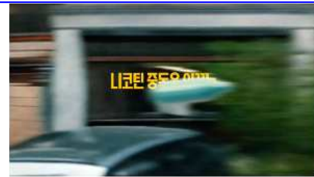
니코틴 중독을 이기는 전자담배