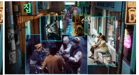
그는 냄새가 없다고 착각한다