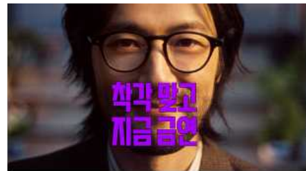
착각 말고 지금 금연