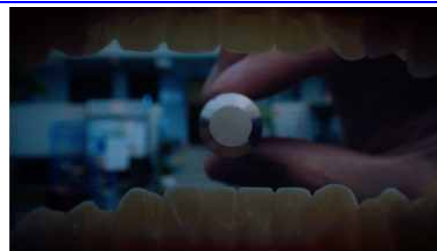
세상 가장 교묘한,