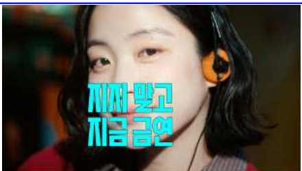
지저 말고 지금 금연