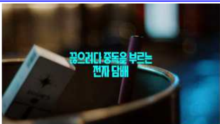
꽂으러다 중독을 부르는 전자담배