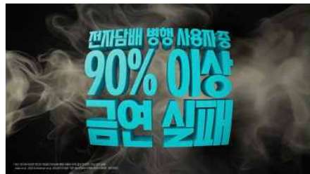
전자담배 병행 사용자중 90% 이상 금연 실패