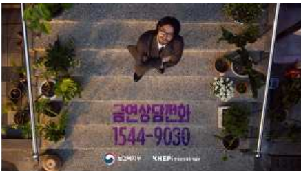
금연상담전화 1544-9030 보건복지부 KHEP 한국건강증진개발원