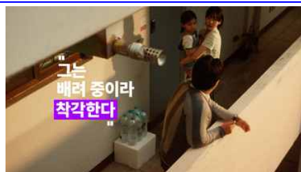
그는 배려 중이라 착각한다