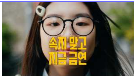
속지 말고 지금 금연