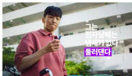
그는 전자담배는 냄새가 없다 둘러댄다