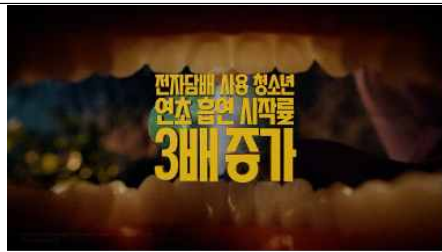
전자담배 사용 청소년, 연초 흡연 시작률 3배 증가