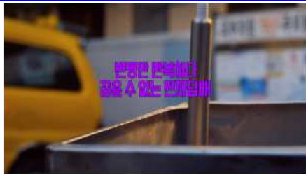
변명만 반복하다 끊을 수 없는 전자담배