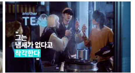
그는 냄새가 없다고 착각한다