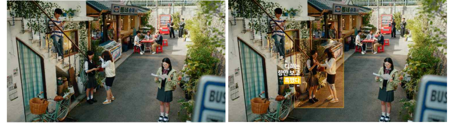
다리는 항만 보고 혹했다