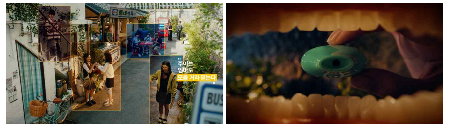
주이는 엄마도 모를 거라 믿는다