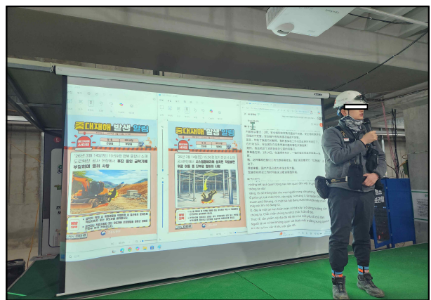
(제조업체) 작업 전 안전점검회의시 활용 (건설현장) 아침 안전조회 통해 사고사례 전파

현장에서의 높은 활용도가 입소문을 타면서 ‘중대재해 사이렌’ 가입자는 '23년 4.7만명, '24년 7.2만명, '26.5월 9.4만명으로 매년 지속적으로 증가