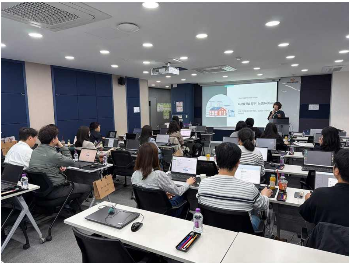
▲ 한국기술교육대학교 직업능력심사평가원에서 4월 개최한 직업훈련 기초컨설팅 현장 사진