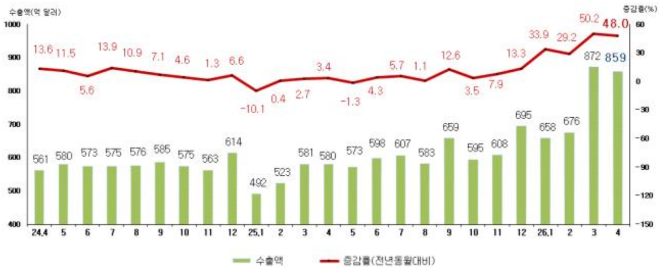
< 월별 수출액 및 증감률 >