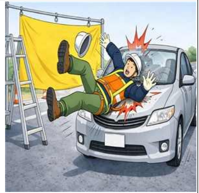
도로변 작업 중 차량 충돌