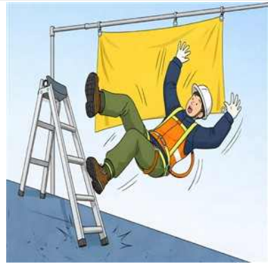
사다리 사용 중 추락