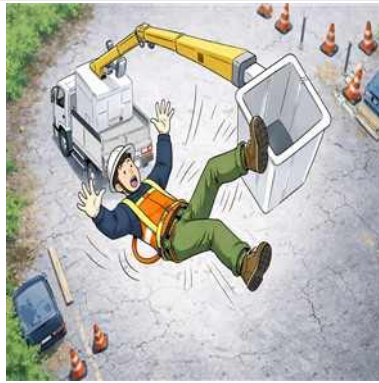
고소작업대 사용 중 전도·추락