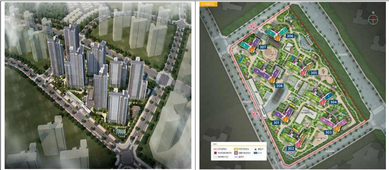
남양주왕숙2 A-3 조감도