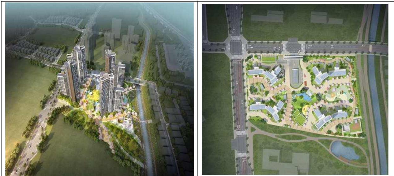
고양창릉 S-1 조감도