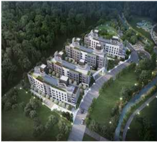
안양관양고 A-1 조감도