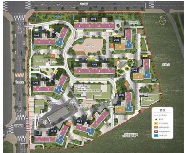
인천계양 A-9 단지배치도