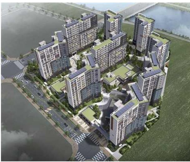
인천계양 A-9 조감도