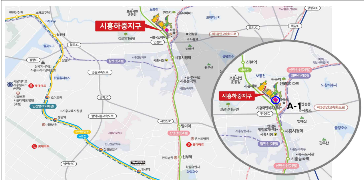
시흥하중 A-1 위치도