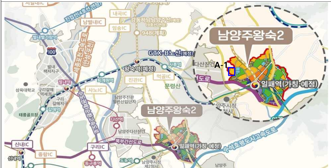
남양주왕숙2 A-1 위치도