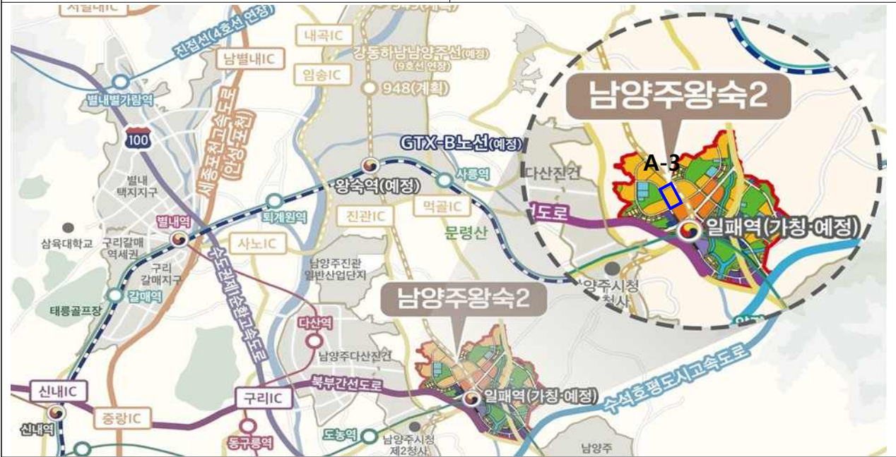
남양주왕숙2 A-3 위치도