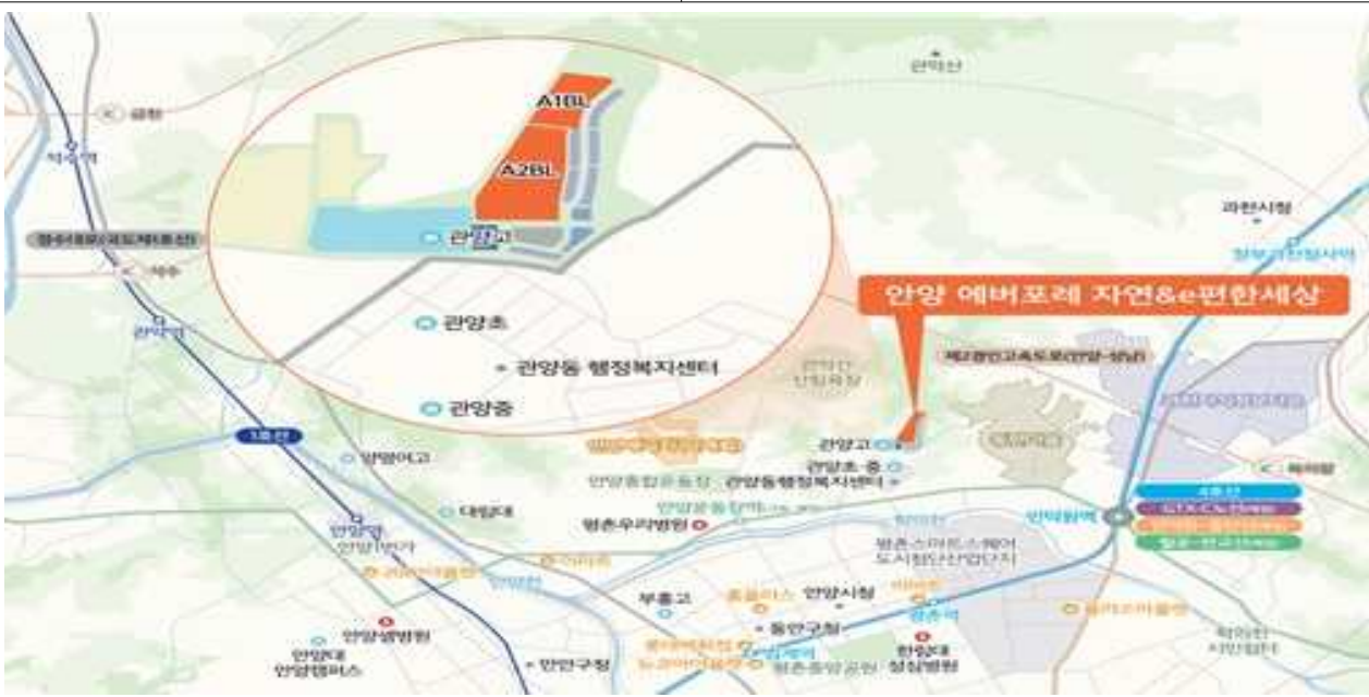
안양관양고 A-1, A-2 위치도