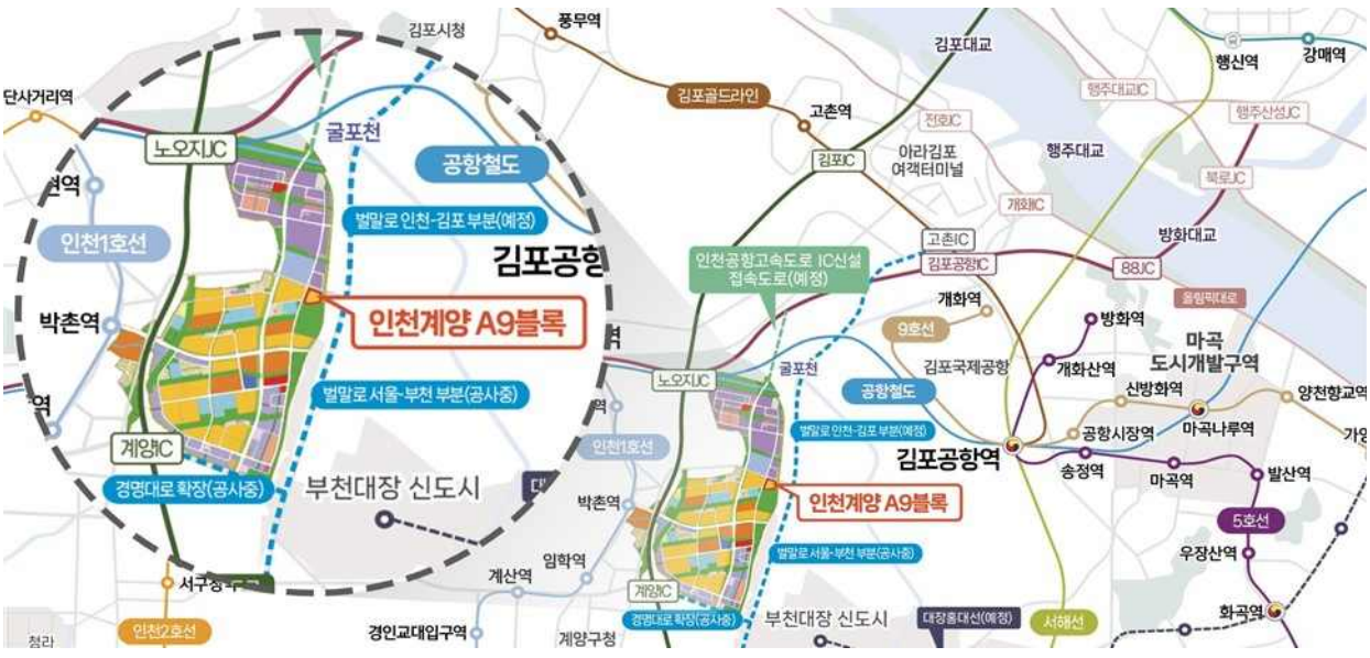
인천계양 A-9 위치도