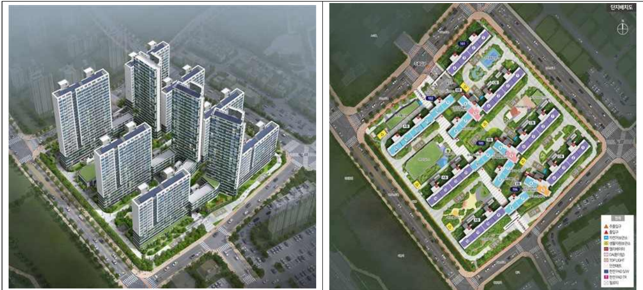
시흥하중 A-1 조감도