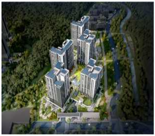
안양관양고 A-2 조감도