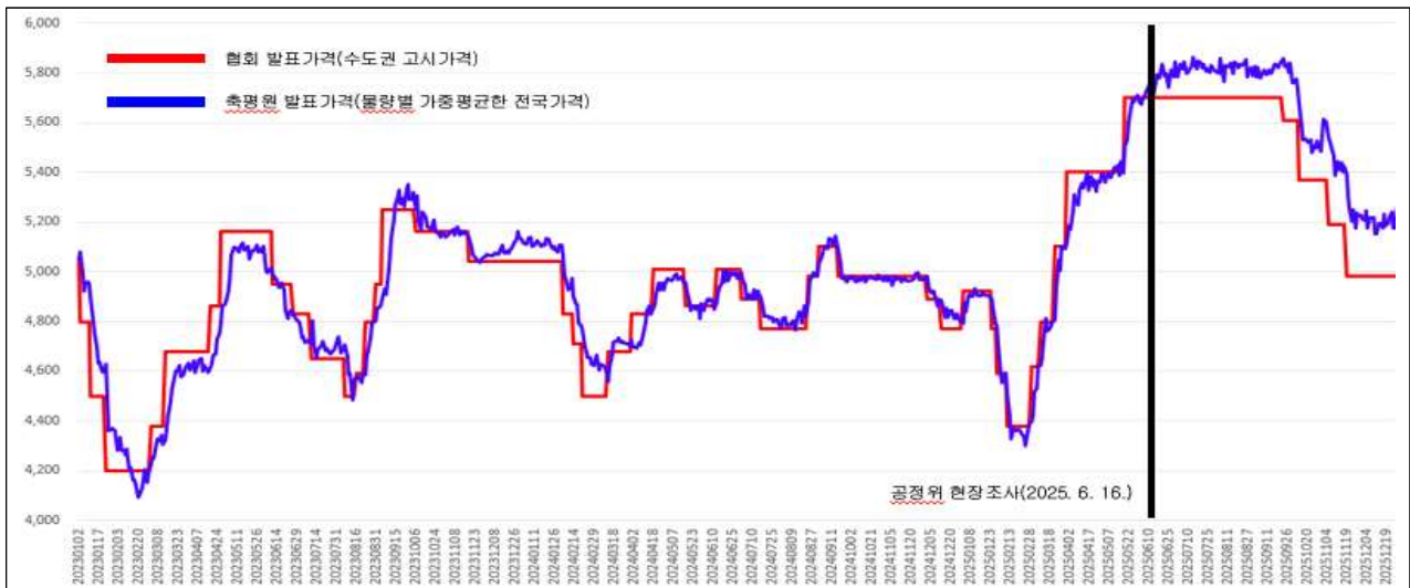
계란 기준가격과 실거래가격 비교(특란 30개 기준, 2023년~)

* 축산물품질평가원은 2018년 3월부터 계란 실거래가격을 매일 발표 중