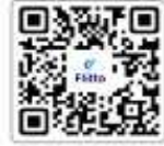
APFRAS 2026 AI 홍보