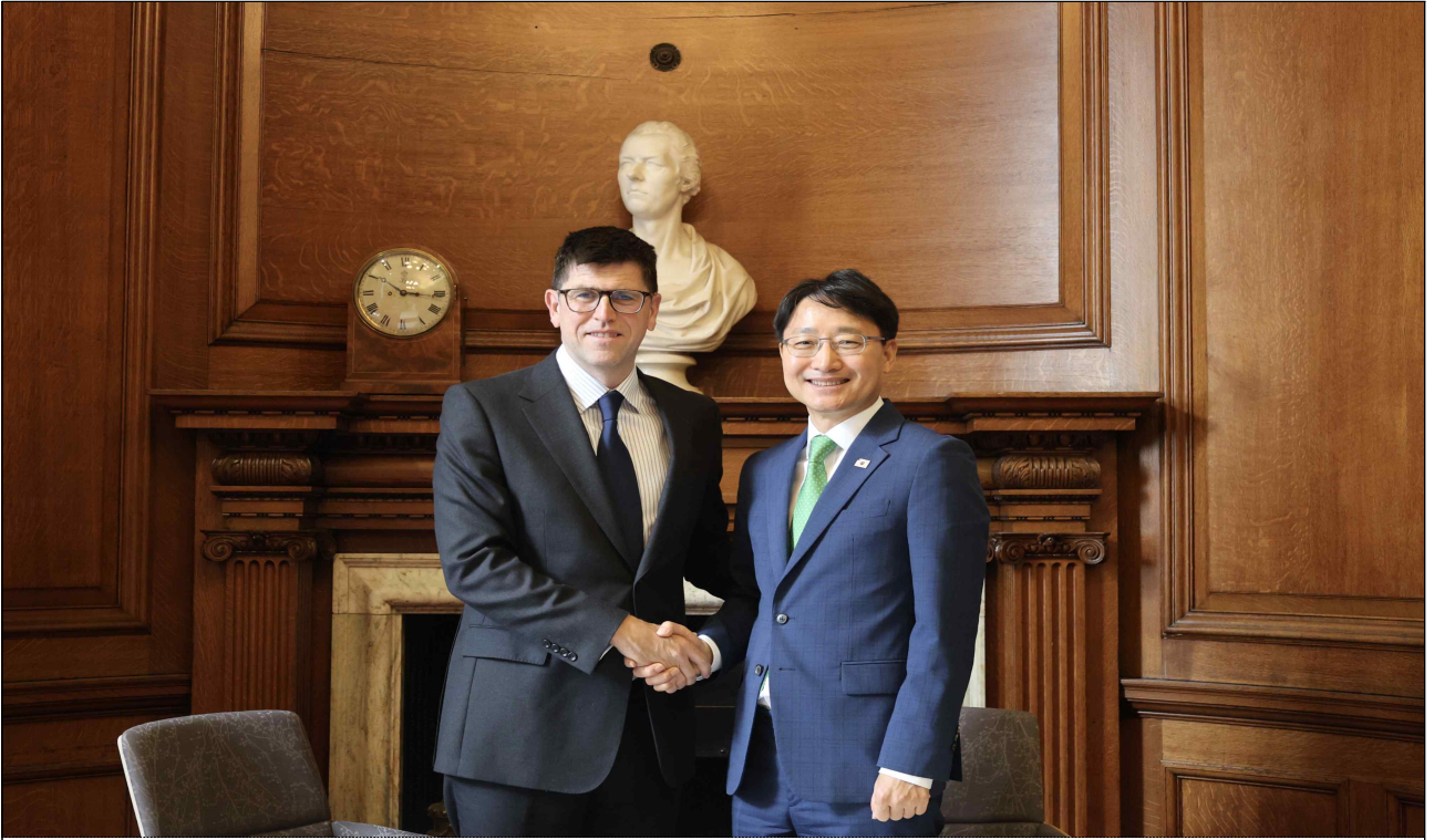
임광현 국세청장과 존-폴 마크스 영국 국세청장이 기념 촬영을 하는 사진