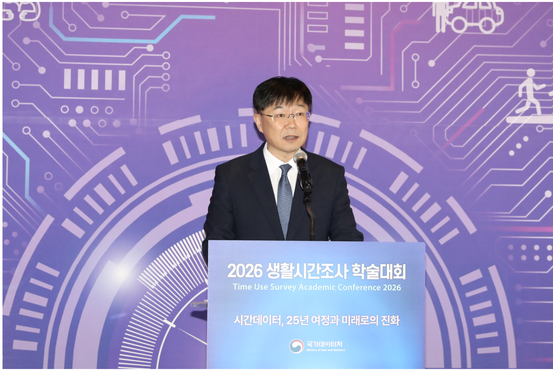
「2026년 생활시간조사 학술대회」에서 개회사를 하는 안형준 국가데이터처장