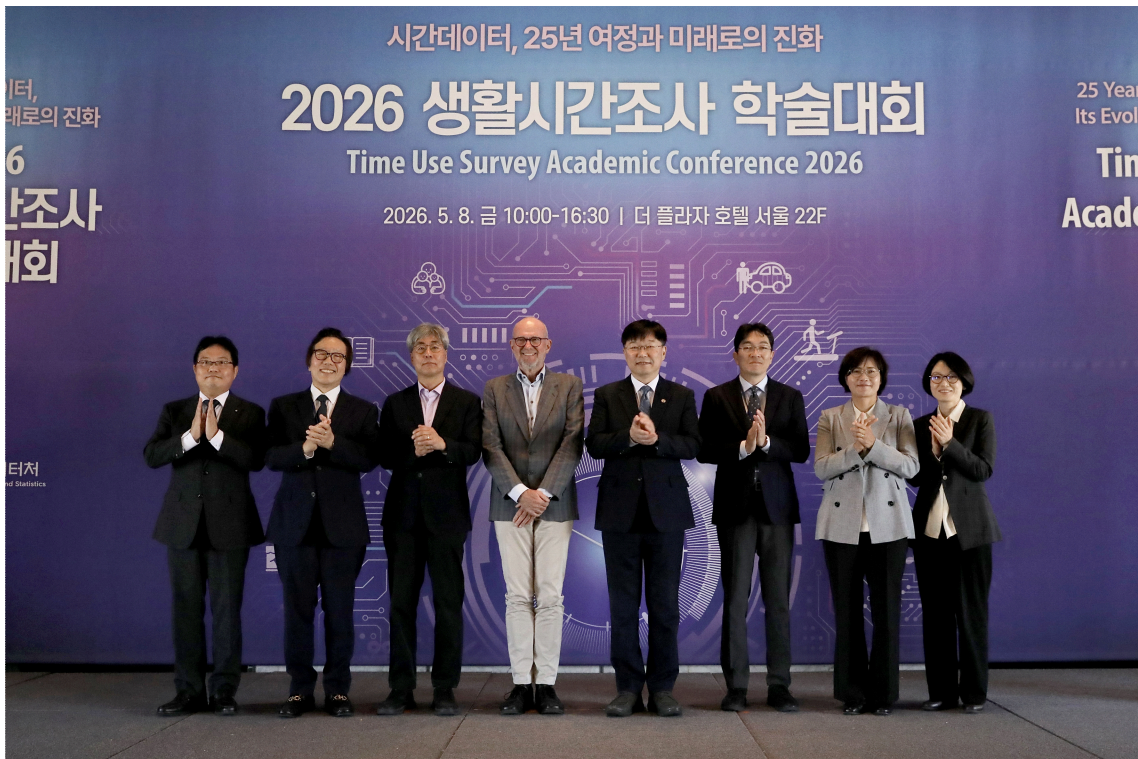
「2026년 생활시간조사 학술대회」 주요 인사 기념 촬영