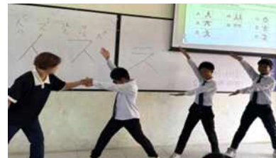
받침 글자 몸으로 표현하기