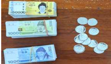
화폐 및 단위·가격 문법 학습 활동

“라오스는 지폐만 사용하기 때문에 학생들이 동전이 포함된 한국의 화폐 체계를 어려워했습니다. 학생들의 이해를 돕기 위해 한국 돈을 작은 크기로 출력해 음식을 주문하고 계산해 보는 수업을 하였습니다. 지폐 속 인물인 세종대왕을 소개하고, 신사임당과 율곡 이이가 ‘어머니와 아들’ 관계라는 점을 설명하자 학생들의 학습 속도가 매우 빨라졌습니다.”