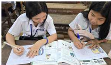
‘나와 친구에 대해 묻고 답하기 수업

“기초학습 기간이 길어 학생들이 지루해한다는 의견이 있어 활동학습 시간에 모두 함께 참여하는 게임을 하고, 학생들이 직접 앞에 나와 수업 도우미 역할을 할 수 있도록 하였습니다.” “교과서에 있는 한국의 특별한 날에 대해 학습하였습니다. 학생들은 한국의 겨울을 가장 방문하고 싶은 계절로 꼽았습니다. 캄보디아에서 볼 수 없는 눈을 직접 보고 싶기 때문입니다.”