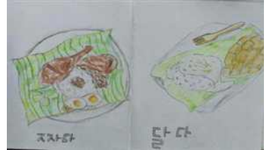
라오스 음식 소개 책 만들기 활동