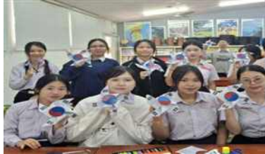
3.1절 기념 태극 바람개비 만들기