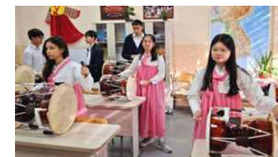
장구와 소고 배우기