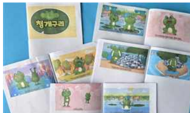
‘청개구리’ 동화책 만들기 활동