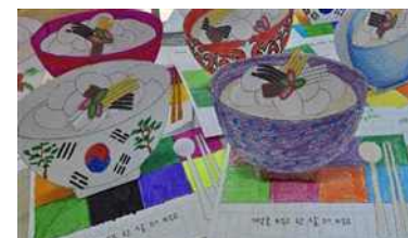
종이로 입체 떡국 만들기 활동