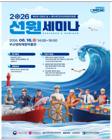
2026 선원 세미나(6.16 / 한국선박관리산업협회)