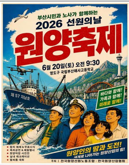
2026 선원의 날 원양축제 (6.20 / 전국원양선원노동조합, 한국원양산업협회)