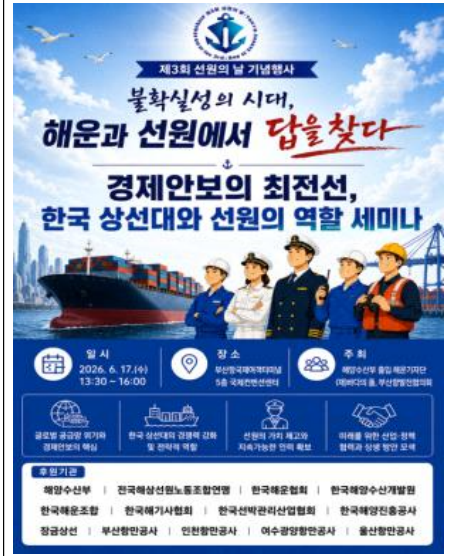
해운기자단 세미나 (6.17 / 해양수산부 출입 해운기자단)