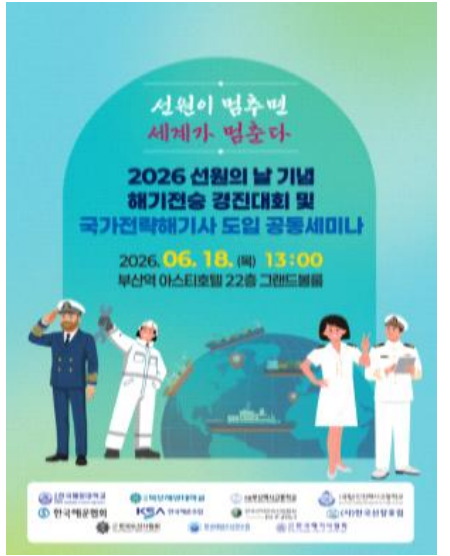
해기전승 경진대회 및 국가전략해기사 도입 세미나(6.18 / 한국해기사협회)