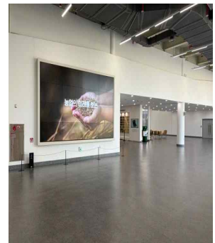
(우천시) 풍잠기원제 (전시관 옆 공간)