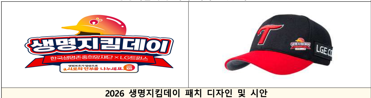
<생명지킴데이 패치 디자인 및 시안>