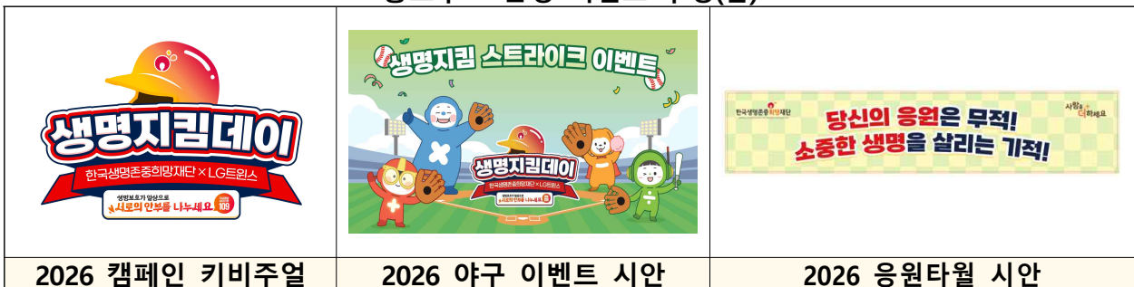
<홍보부스 운영 이벤트 구성(안)>