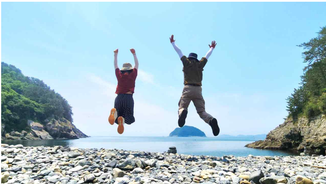
연대도 몽돌 해변