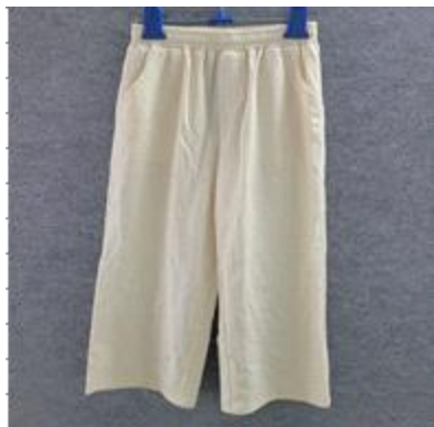
< 쟁점물품 >

② 다음으로, 실제 트임이나 여밈 구조가 없으나 남아용 바지의 여밈 형태를 본뜬 박음질이 된 바지를, △소년용 긴바지(제6103.49-0000호, 한·중 FTA 2.6%), △소녀용 긴바지(제6104.69-0000호, 한·중FTA 13%) 중 어느 항목에 해당하는지 심의하였다.