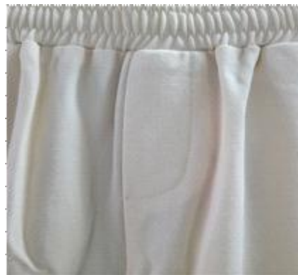
< 앞트임 박음질 >

위원회는 해당 물품에 실제 여밈이 없고 남자아이용으로 볼만한 객관적인 디자인 요소도 확인되지 않으므로 남녀공용 의류로 판단하고 세계관세기구(WCO) 규정*에 따라 소녀용 바지로 결정하였다.