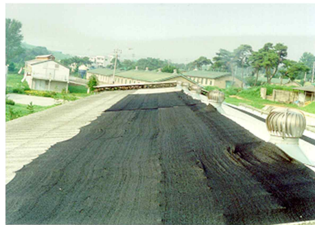
축사 지붕에 차광막 설치