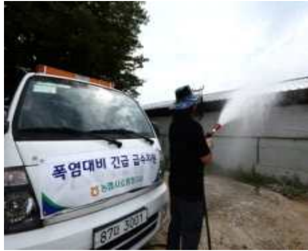
양돈농가 현장 긴급급수 지원