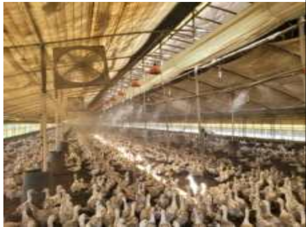
오리농가 안개분무시설 가동