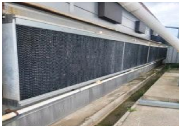
육계농가 쿨링패드 설치