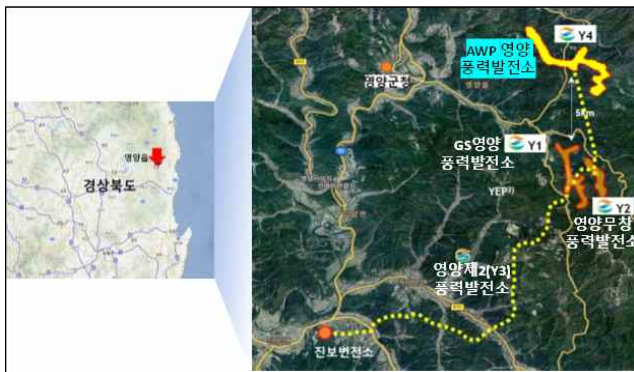
【 사업장 위치도 】