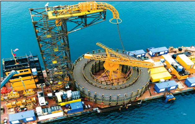
【 해저케이블 포설선 】