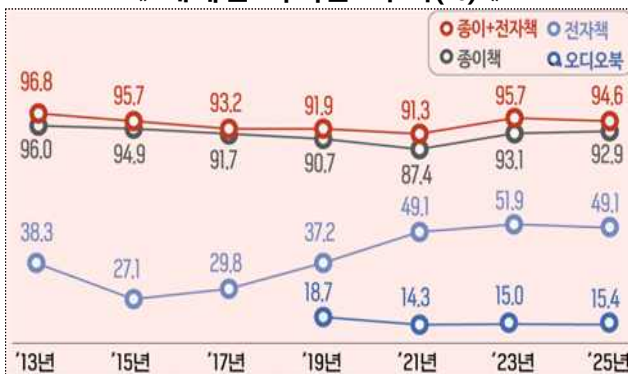
《 매체별 독서율* 추이(%) 》