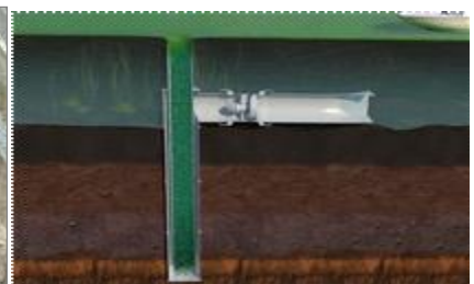
역사이펀 현상 활용, 상층 남조류를 수심 약 70m 심층부로 유입사멸