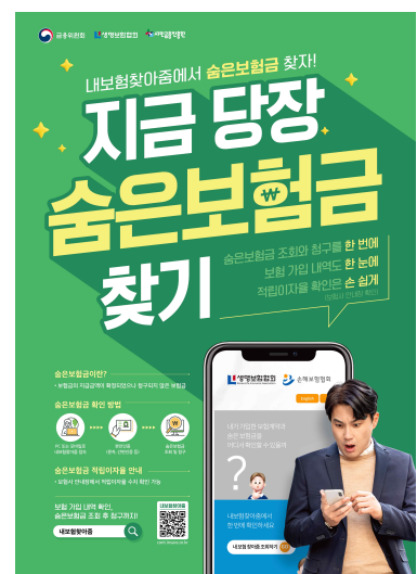
CI · 포스터