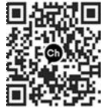
1342용기한걸음 마약류 상담센터

마약 중독은 벗어날 수 있는 질병입니다. 마약류 중독문제 등으로 어려움을 겪고 있거나 주변에 이런 어려움을 겪는 가족·지인이 있다면, 24시간 익명·비밀보장 마약류 전화상담센터 ☎1342 또는 카카오톡 채널 “1342용기한걸음 마약류 상담센터” 에서 전문가의 도움을 받으실 수 있습니다.