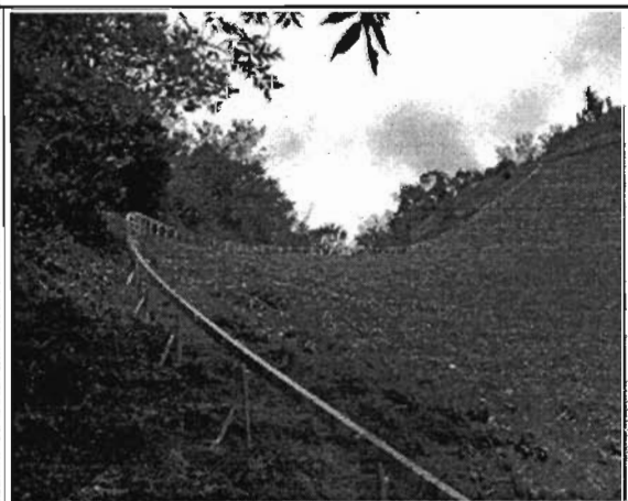
· 사업명 : 농업용 모노레일 설치현장 · 사업장 : 울릉군 서면 남양3리 148