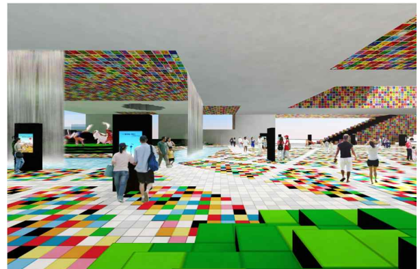
1층 필로티 공간