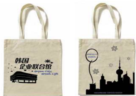
외피 재활용 쇼핑백