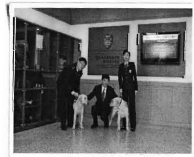
WCO 사무총장 방문('09.3)