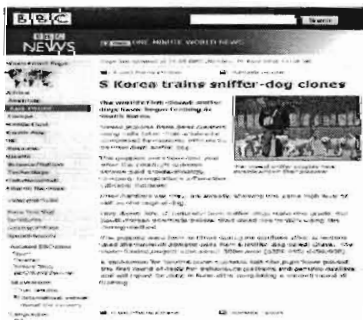
영국 BBC 보도('08.4.)