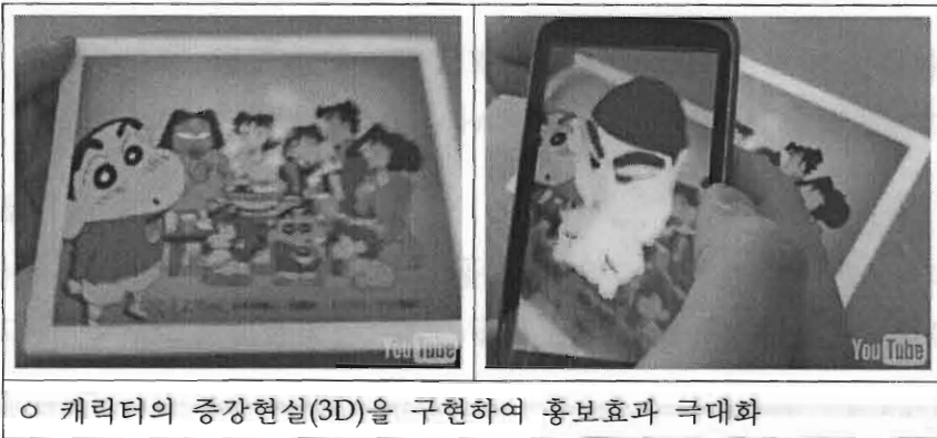
○ 캐릭터의 증강현실(3D)을 구현하여 홍보효과 극대화