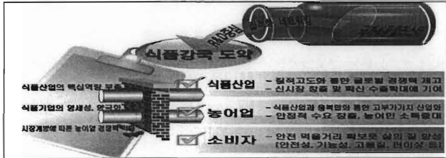
<국가식품클러스터 역할 및 효과>