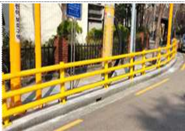
차량용 방호울타리(SB1 등급)