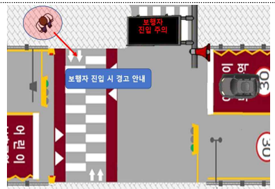
스마트 횡단보도 (개념도)