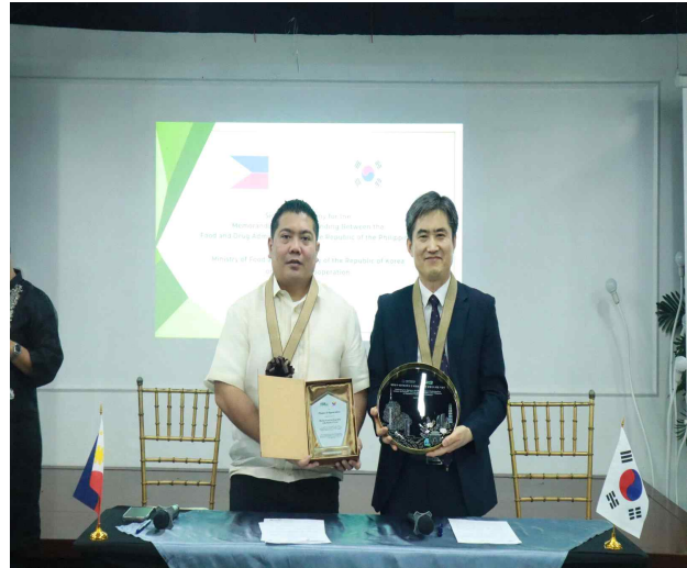
한-필리핀 화장품 양해각서 체결 기념