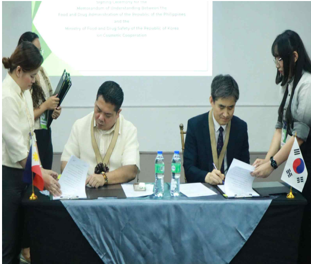
한-필리핀 화장품 양해각서 사인