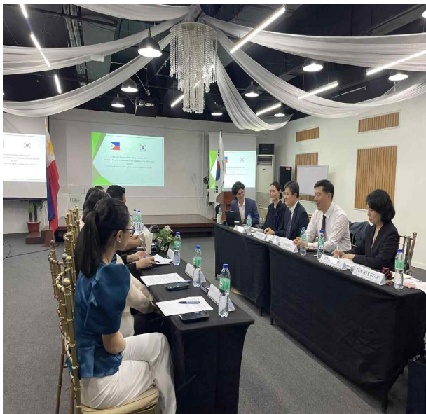
한-필리핀 화장품 규제협력을 위한 논의