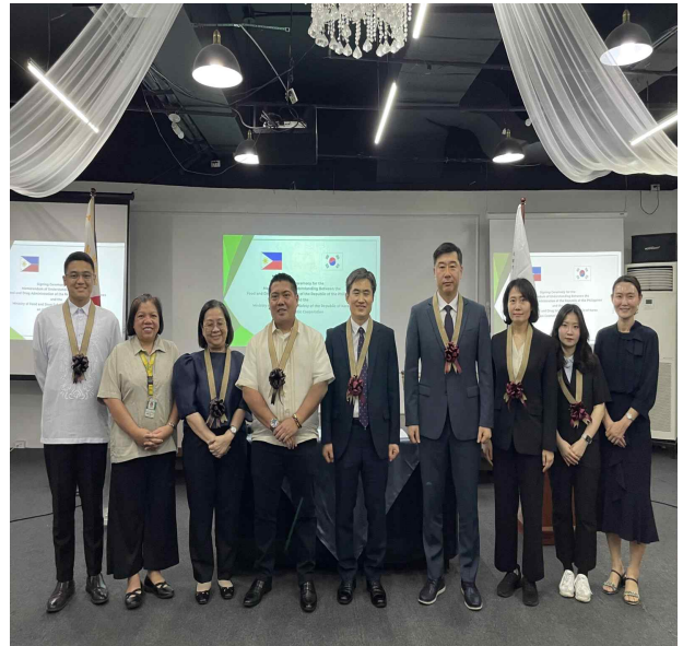
한-필리핀 화장품 양해각서 체결 기념