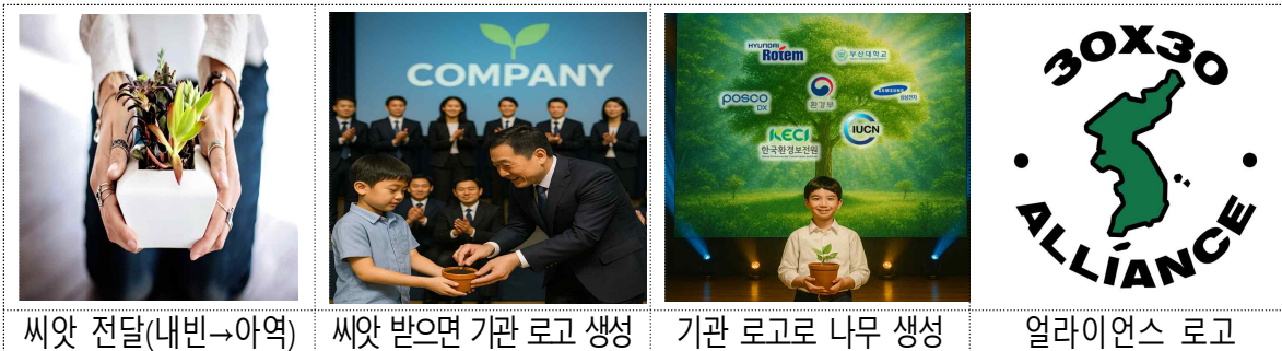
씨앗 전달(내빈→아역) 씨앗 받으면 기관 로고 생성 기관 로고로 나무 생성 얼라이언스 로고