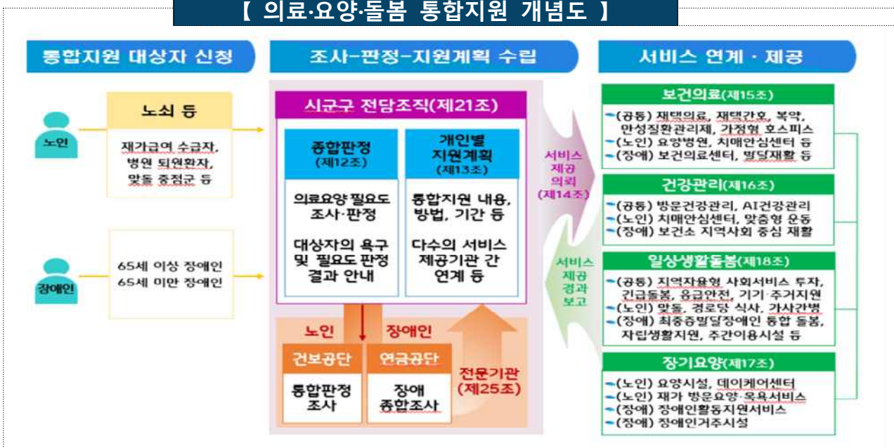
【 의료·요양·돌봄 통합지원 개념도 】