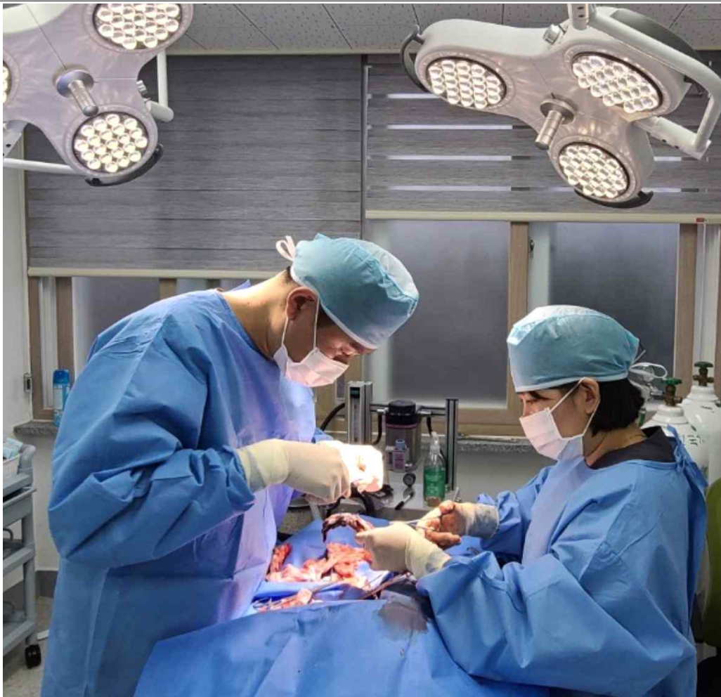
알락꼬리여우원숭이 팔 분쇄골절 수술('25.3.6)