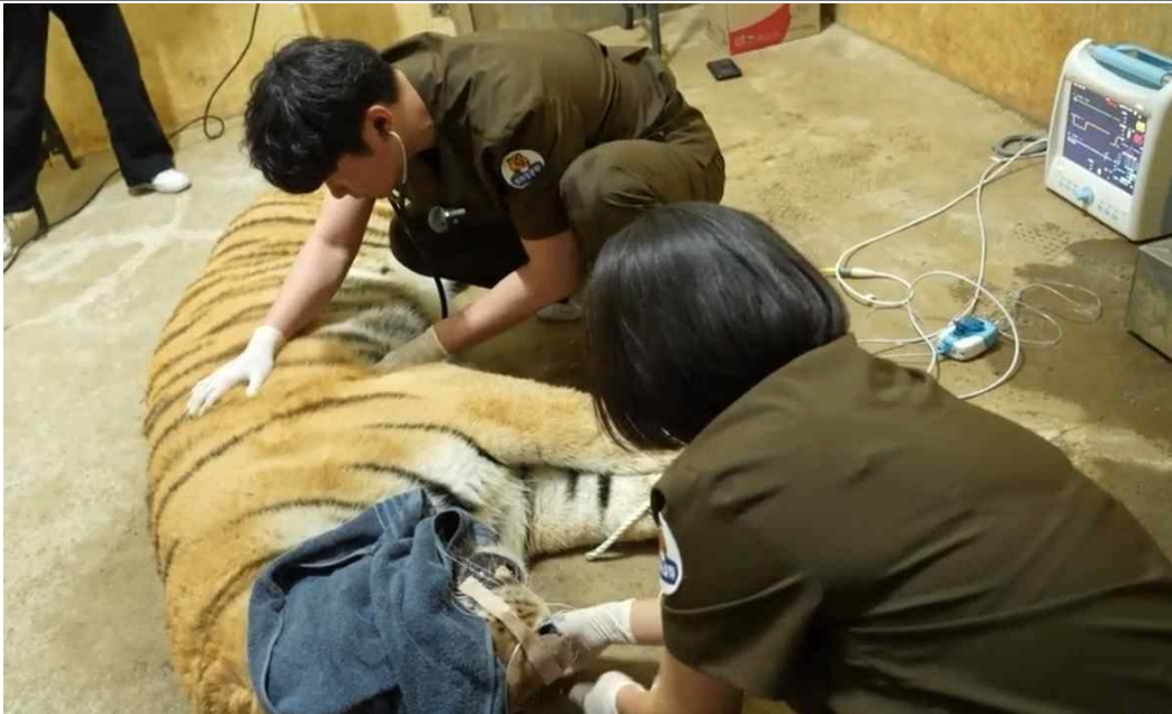
평소 진료 사진